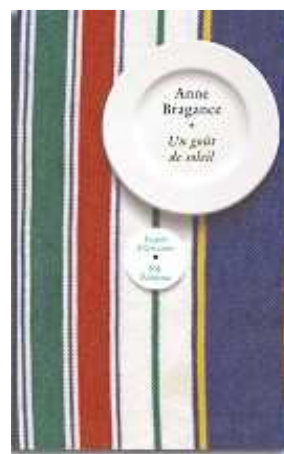
Anne Bragance Un goût de soleil