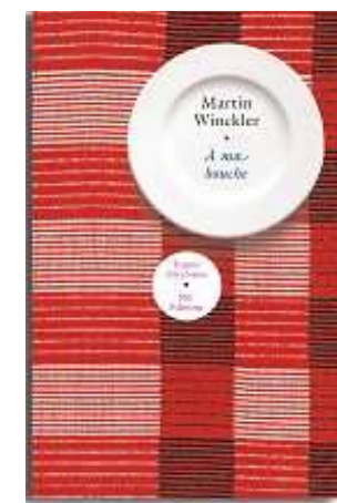
Martin Winckler A ma bouche

Nil éditions 24, avenue Marceau - 75008 Paris Service de presse Tél. : 01 53 67 14 59 sperrier@robert-laffont.fr