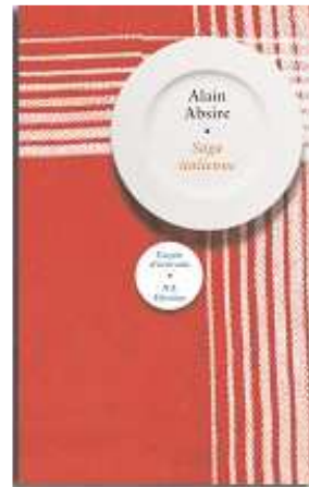
Alain Absire Saga italienne